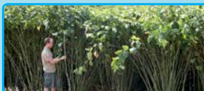
Energiepflanze Igniscum Candy, Dauerkultur