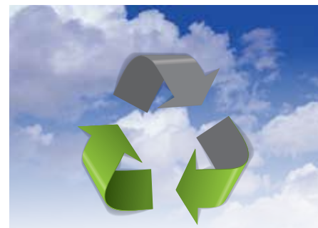
Saubere Luft ist immer fein!